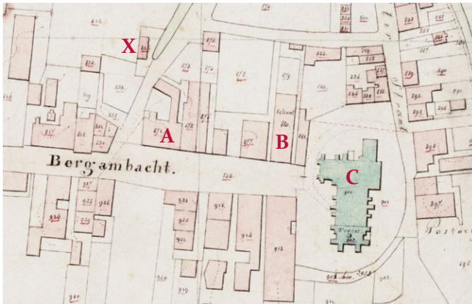
Kadastertekening van het dorp ca. 1829 met de herberg (A) en de schuur (X), de school (B) en de kerk met kerkhof (C).

Begraafplaats, die Lodewijk Napoléon in 1806 in ons land had geïntroduceerd; zo kwam er ook hier zo'n nieuwe begraafplaats.