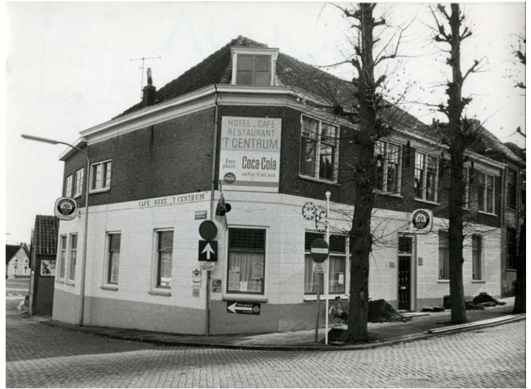
Hotel-café-restaurant 't Centrum zoals velen het zich herinneren