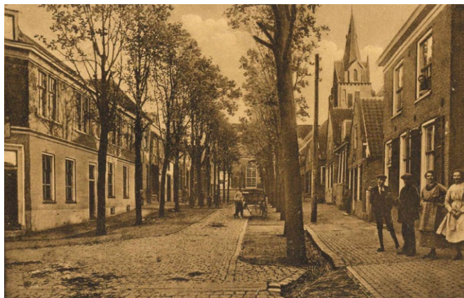
De sfeervolle Raadhuisstraat die in 1850 nog Dorpstraat heette; links de herberg die in 1885 werd gebouwd op de plek van het Oude Rechthuis en daarom ook zo werd genoemd.