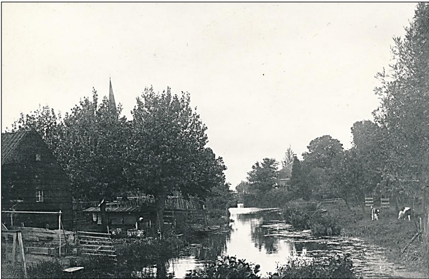
Berkenwoude: Papensloot ongeveer 1920.

Om te zorgen dat niet alle bestuursleden tegelijkertijd aftredend zijn zal het bestuur voor de aankondiging van de ALV in 2017 een schema presenteren om dit gelijkmatiger te verdelen.