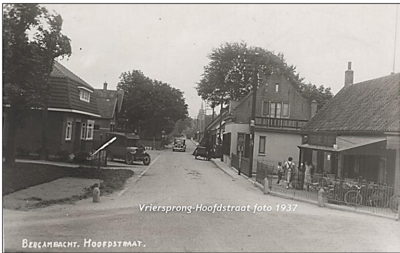
Viersprong-Hoofdstraat foto 1937