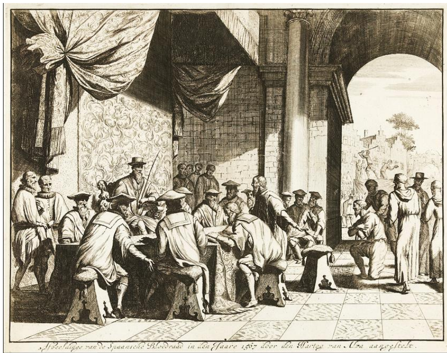
Arbeidslage van de Spaansche Bloedraad in den Jaare 1567 door den Hertog van Alba aangezeekt.

Werd Alva's harde hand ook in Bergambacht gevoeld? Waren inwoners betrokken bij de onrust rondom de Beeldenstorm of was men hier juist trouw gebleven aan de Rooms-Katholieke kerk? Tijdens de lezing wordt bij deze en andere vragen uitgebreid stilgestaan.