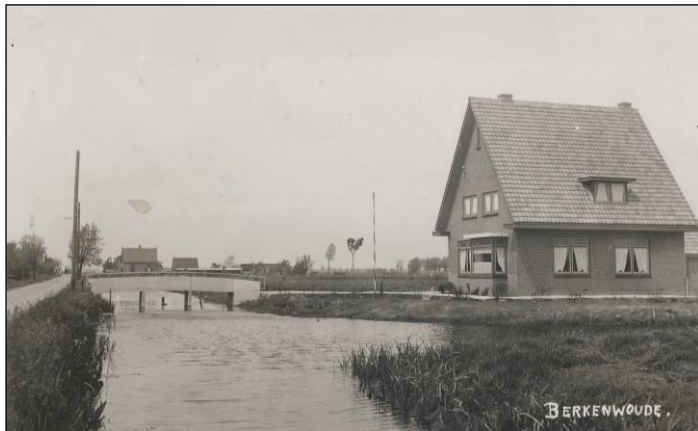
Schoolhuis Chr. School 1938