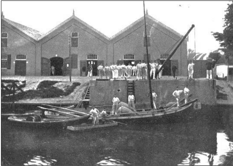
Torpedisten bij de sloepenloods in Brielle