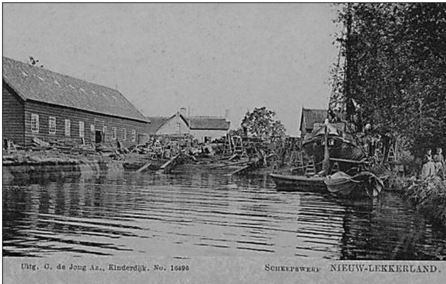
Scheepswerf Stam in Nieuw-Lekkerland