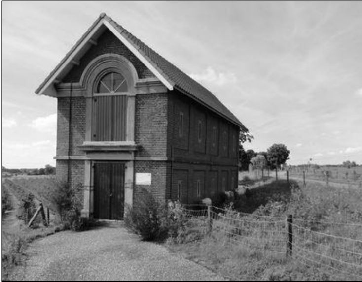
Dijkmagazijn te Deest