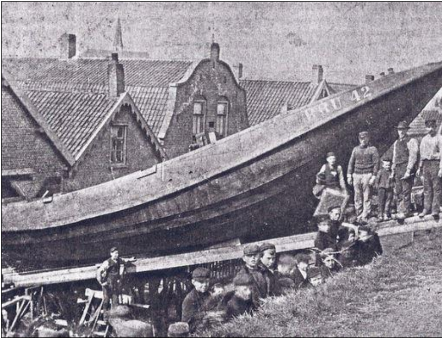
Scheepswerf Van Duivendijk. Het slepen over de kruin van de dijk.

In Krimpen aan de Lek was het “de Rijsdijk”. In Lekkerkerk “Van Duivendijk” of de “Rijnvaart”. Ook die zijn verdwenen. In Nieuw-Lekkerland was de sloperij “De Koophandel”. Daar zijn heel wat schepen gesloopt. Het kleine werfje “Van Stam”, daar werden vissersschepen gebouwd, veelal voor de Zeeuwen.