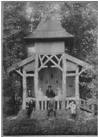
Prietel Overtuin Bisdom van Vliet (helaas afgebroken)