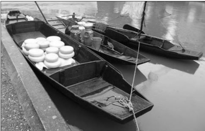
Kleine schouw: Melkschouw Grote schouw: Modder-, mest- of strontschouw

Bij welke boerderij zie je nu nog een melkschouw en een mestschouw? Verder kan je haast nergens meer varen vanwege de modder en het vuil in de sloten. Ook dit is op enkele uitzonderingen na verleden tijd. De meeste schouwen hetzij hout of ijzer zitten onder water of zijn gesloopt. (Toen dhr. Den Ouden dit opschreef <1975> was dit maar al te waar. Gelukkig is daar thans een keer ten goede in gekomen en zien we in de zomermaanden de jeugd weer lustig varen).