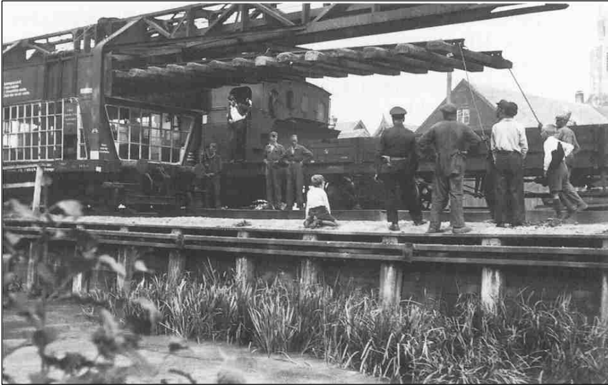
Ontmanteling spoorlijn Schoonhoven – Gouda 1943.

Bergstoep, daar was het anders, daar kon meer, mocht meer, zo leek het. Daar hadden ze een speeltuinvereniging die feesten organiseerde. Entree één gulden, een zitplaats kostte een kwartje. Op zo'n zomerse zaterdagavond was de Dijklaan vol vrolijke fietsers op weg naar Bergstoep. Ze kwamen vanuit de verre omgeving naar de speeltuin onderaan de dijk. Anie Palmen, De Spelbrekers, de pas beginnende Ria Valk en Andre van Duin met zijn bandparodieën traden er op, evenals acrobatenduo de Crocksons die later, toen ze wat stijver werden, doorgingen als Bassie en Adriaan. Zelfs Corry Brokken, toen al een ster, verscheen op het podium, maar ze liep kwaad weg toen het publiek met haar meezong bij 'Milord.' "Het spijt me" klonk het kortaf in de microfoon en weg was ze.