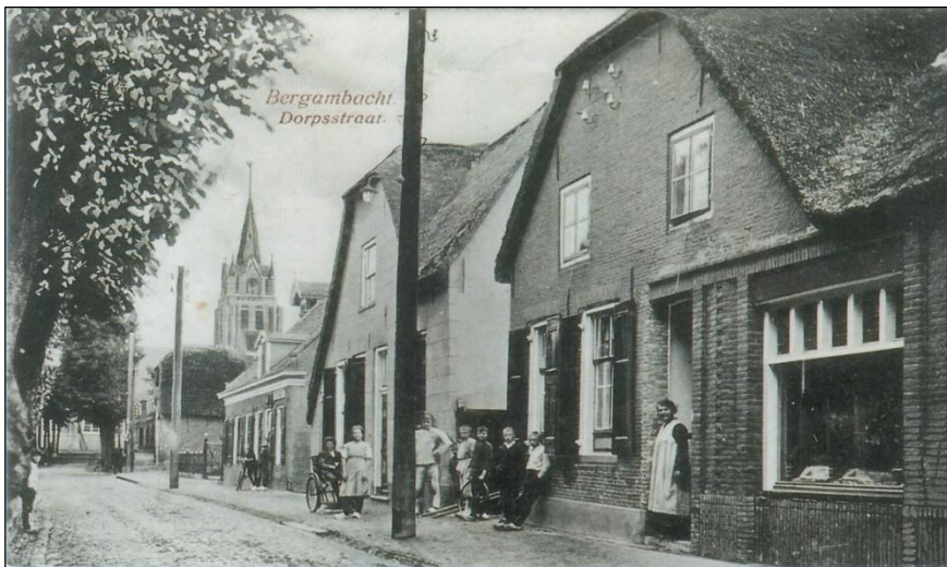
Toen Dorpsstraat Bakkerij Blanken Foto rond 1925