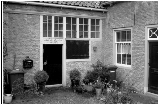
De pui in Heenvliet