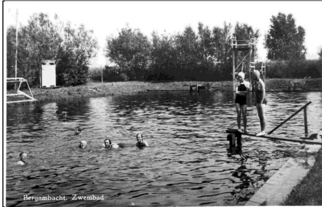
Het zwembad aan de Lekdijk in de jaren 50

de Lek en bij opkomend tij liet men de modderput weer vollopen. Want een modderput was het. De controle van de waterkwaliteit bestond uit het meten van de temperatuur die met een krijtje op een bord werd geschreven dat aan een kleedruimte hing, hoewel de term 'hok' beter paste. Maar we wisten niet beter, speelden met een zakmes 'landverovertje' in het zand en voetbalden met het kleedhok van BZC als doel.