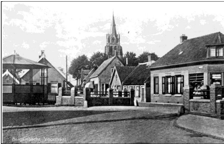
Voorstraat met muziektent 1951