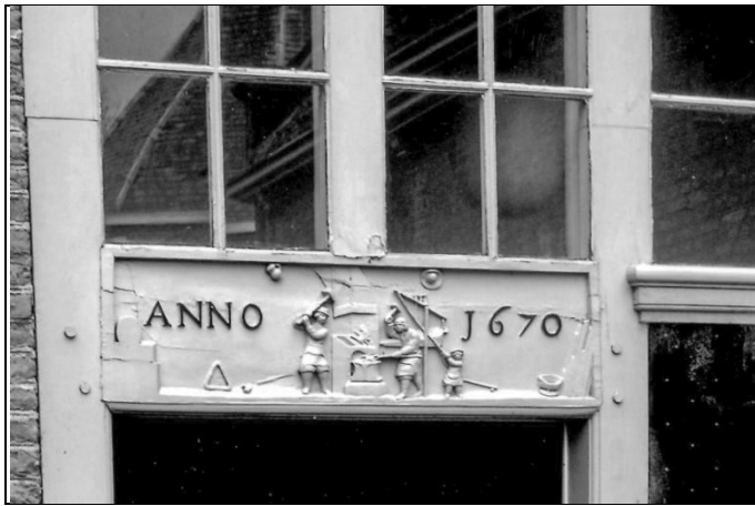
Gevelsteen in het deurkalf

met afbeelding en een aantal ramen met glasroeden. De kunstig uitgesneden afbeelding in het deurkalf draagt het jaartal 1670 en toont een smidse in bedrijf, waarop is te zien hoe de smid en zijn knecht het ijzer bewerken, bijgestaan door een hulpje die aan een blaasbalg trekt.