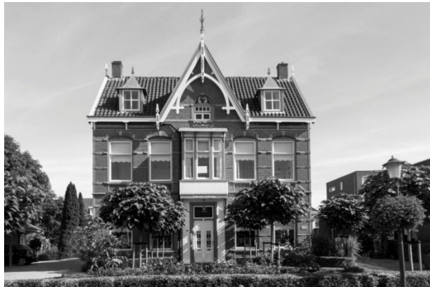
De dokterswoning aan Hoofdstraat 139