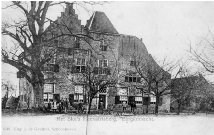
Het Slot in 1902