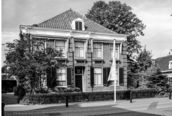
De in 1999 gesloopte dokterswoning

Hij liet ook een huis voor zijn vader bouwen tegenover zijn woning. Het pand waarin nu Pieters Restaurant is gevestigd.