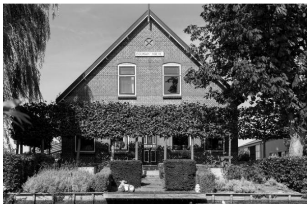
Bouman's Hoeve aan de Benedenberg