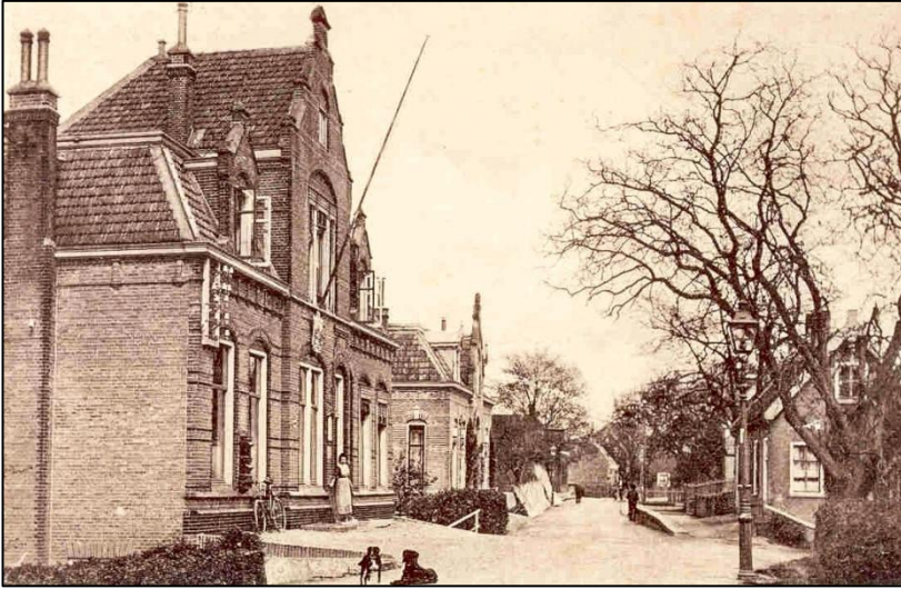
Ammerstol Lekdijk jaren '30

De ander liep een kapot geschoten oog en een buikschot op en werd ondergebracht bij een bewoner van het dorp. Hoewel hij heeft liggen kermen van de pijn, hebben de leden van zijn onderdeel, die naar beide soldaten op zoek gegaan waren, hem niet gevonden. Er is ook nog door een van hen een handgranaat naar de schietende Ammerstollenaren gegooid, maar deze richtte weinig schade aan. Van den Berg had slechts een verwonding aan een hand. De Duitser die het vuurgevecht overleefde is later door een dokter naar het Van Iterson ziekenhuis in Gouda vervoerd, maar bezweek uiteindelijk toch. Toen de Duitsers begrepen wat zich had afgespeeld lag het in de bedoeling strenge maatregelen te nemen tegen de bevolking. Over de aard van de te verwachten represailles lopen de verhalen hier nogal uiteen. De meeste