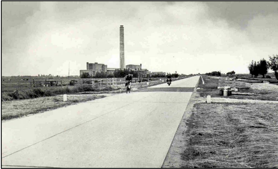
De N210 in 1959

Toch was de verkeerstoename de eerste jaren te overzien. De B-weg ernaast was er nog niet. We fietsten gewoon tussen het andere verkeer naar Lekkerkerk en Krimpen. Dat verkeer bestond hooguit uit enkele tientallen auto's. De bus naar Gouda reed door de Hoofstraat via de Kadijkselaan en de Opweg naar Stolwijk en verder over de Goudse weg. Er belandde op die smalle wegen nog wel eens een auto die bij het uitwijken voor een tegenligger in de berm wegzakte in de sloot. De provinciale weg van Bergambacht naar Gouda, die voor het grootste deel op het tracé van het voormalige spoorlijntje ligt, kwam een jaar later. Het laatste stuk, vanaf de kruising met de N210 tot het veer, lag nog lange tijd braak. Het was een ideaal speelterrein. We bouwden er hutten, voetbalden en vochten met ons dorpsclubje tegen