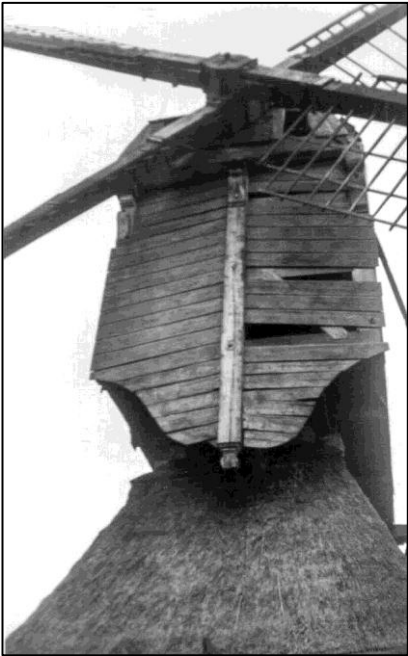
De Bachtenaar kort na de oorlog

niet erg leefde. Na de oorlog moest er geld verdiend worden en niet worden uitgegeven aan 'oude rommel' als bijvoorbeeld de Bachtenaar, de wipwatermolen aan de noordoostelijke gemeentegrens.