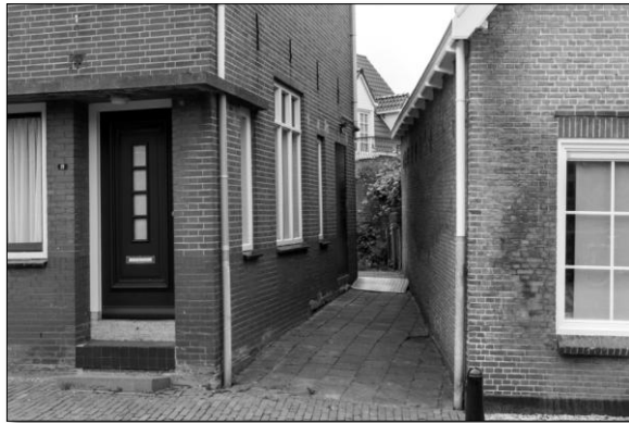
Het politiebureau in het voormalige postkantoor linksachter in de gang aan de Burgemeester Uilkensstraat