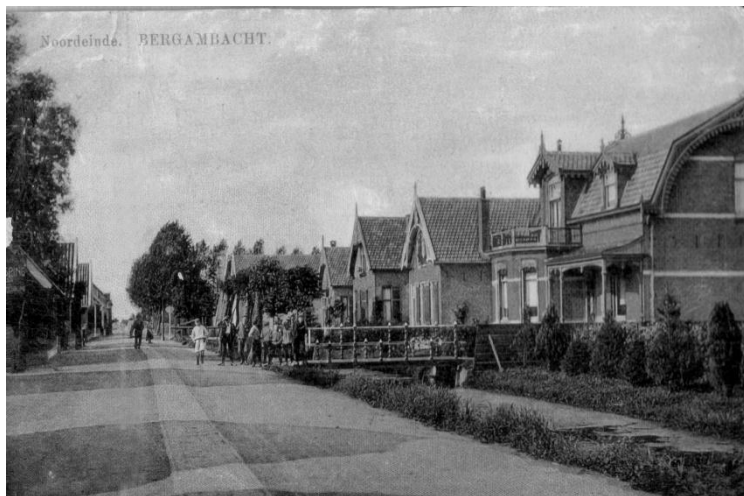
Het 'Noordeinde' rond 1910. Hoofdstraat 113 is de fraaie villa uiterst rechts.

De Schoonhovense Courant meldde op 7 maart 1958 in een uitgebreid artikel over Rinus M. dat zij het eerste blad in het land waren die de zaak in de publiciteit hadden gebracht. Iedereen in het dorp wist natuurlijk om wie het ging, maar de regels bepaalden nu eenmaal dat de naam niet voluit werd geschreven. Verder was er van enige discretie nauwelijks sprake, want de woning stond in Het Vrije Volk groot afgebeeld naast een artikel over hetzelfde onderwerp, alleen het huisnummer ontbrak.