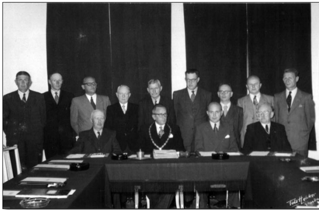
De gemeenteraad van 1953

Men was nog niet gekomen van de eerste klap of de tweede viel al. Er gingen natuurlijk al snel smeulige verhalen rond over mensen die uit principe niet aan loterijen deelnamen, maar nu onverklaarbare aankopen deden, ja zelfs een huis lieten bouwen. “Zou hij ook geld hebben gewonnen?” Smullen geblazen! Zeker is wel dat de prijzen niet bij één persoon zijn gevallen. Er bestonden toen ook al loterijverenigingen. Mogelijk is dit verhaal de aanleiding geweest om De HOKO op te richten in 1944. Zoals gezegd bestonden er al eerder loterijverenigingen. Een advertentie in de Schoonhovense Courant uit 1935 toont aan dat er ook toen stevige prijzen vielen. Ga maar na: In een tijd dat men per week enkele tientjes verdiende was F8500,- een enorm bedrag. Of de 3 verenigingen, De Voharding, Kadijksch Avontuur en De Blijde Verwachting elk dat bedrag kregen uitgekeerd of het moesten delen is niet goed op te maken uit de advertentie. Maar misschien zijn er nog mensen die meer weten over dit geval en de prijzen die ik eerder noemde en voor zoveel opschudding zorgden.