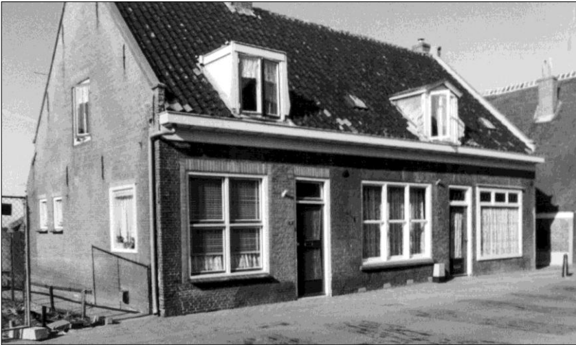
Het dubbele pand aan de Hoofdstraat waar tot 1938 het postkantoor was gevestigd. Later slagerij De Mik en tegenwoordig de ingang van de P.J. Smitsstraat

Zelfs de kerstkaarten ontkwamen niet aan de omslag en worden massaal digitaal verstuurd. Vooral nu de kosten tot een bedenkelijk niveau zijn gestegen. Ooit was het postbedrijf een instituut, een begrip. Voormalige architectonische parels in wat grotere plaatsen getuigen nog van de grandeur die het bedrijf toen als vanzelfsprekend bezat. We hoeven er helemaal niet ver voor te reizen om de stille getuigen van die tijd met eigen ogen te aanschouwen. In Ammerstol aan de Lekdijk en in de Schoonhovense Lopikerstraat zijn de voormalige postkantoren nog steeds te vinden. Niet zo uitbundig van ontwerp als bijvoorbeeld het oude postkantoor aan de Rotterdamse Coolsingel, maar niettemin toch met een uitstraling die een rijk verleden in zich draagt.