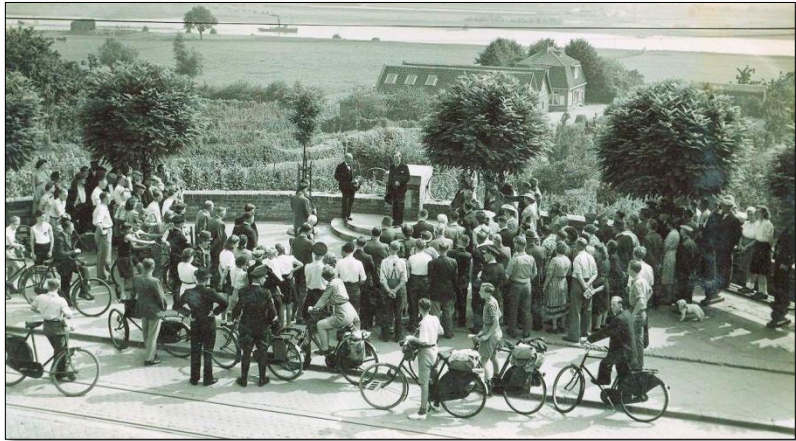
De onthulling van het gedenkteken in 1949 in Rhenen

gedenkteken hadden geschonken aan Rhenen. Bij het zoeken naar informatie over een heel ander onderwerp stuitte ik op een brief