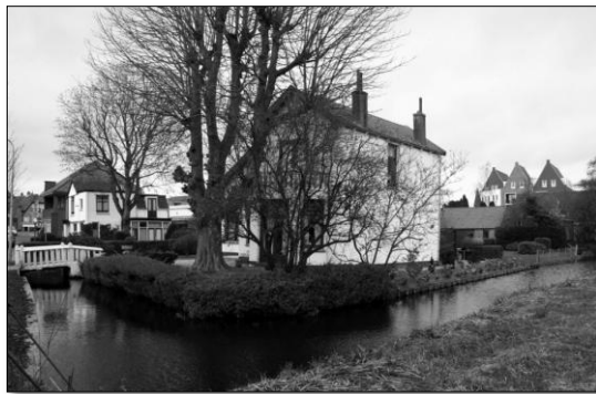
Villa Mon Désir (links) en Villa Tannie, gesloopt in november 2020

Onlangs zijn weer een 2-tal beeldbepalende panden in de Burg. Uilkensstraat tegen de vlakte gegaan. Villa Tannie en villa Mon Désir. Gelukkig hebben we ze op beeld vast kunnen leggen toen ze nog bewoond waren. We doen ons uiterste best om ons archief ‘bij de tijd’ te houden. Als u mee wilt doen: graag. Denkt u dat er ergens iets gaat veranderen of hebt u kennis van concrete plannen, maak a.u.b foto’s en mail ze ons, of laat het ons weten, dan maken wij de foto’s.