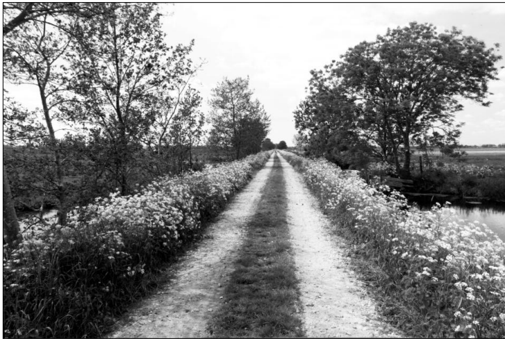
Tiendweg-oost tussen Okkerskade en de Kerkweg naar Lekkerkerk