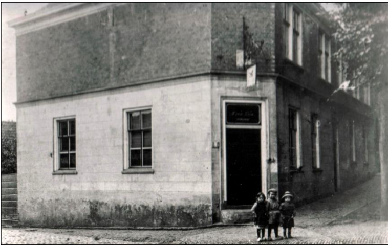
Café Het Bonte Paard omstreeks 1915. In 1928 kreeg het de naam 't Centrum