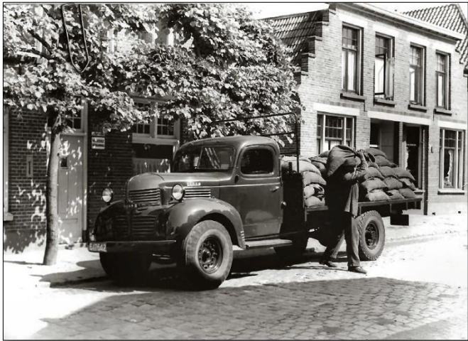
De kolenboer in de jaren '50-'60