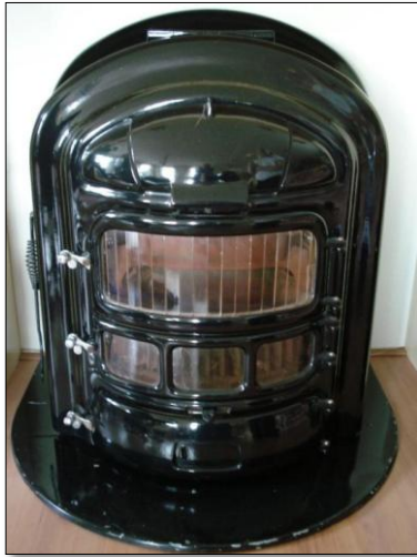
Een Beekershaard uit de jaren '50

En dan was er nog cokes, een afvalproduct van de gasbedrijven en zo ongeveer de goedkoopste brandstof, maar ook de meest vluchtige soort om je huis te verwarmen. Veel calorische waarde bezat het niet. Voor eierkolen en briketten zou in de huidige tijd waarschijnlijk zelfs een stookverbod gelden, vanwege de enorm hoge concentratie aan teer en andere bedenkelijke elementen waaruit ze waren samengesteld.