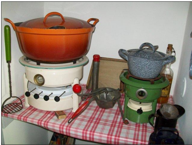
Een 4-pits- en een 1-pits oliestel

In de al eerder genoemde periode vanaf begin 20 e eeuw kwamen ook petroleumstellen in zwang. Ze waren klein, waren een goede warmtebron om op te koken en vooral in de zomer gaf dat voordelen. Je hoefde niet de kachel of het fornuis te stoken om te koken tijdens hoogzomer. Daarbij waren ze ook relatief goedkoop in aanschaf. Het eenpittertje als warmhoudapparaat, tot de grote drie-of vierpitter om een complete maaltijd op te koken. De petroleumboer, meestal met een handkar of hondenkar werd een bekende verschijning in het straatbeeld. Al snel breidde zijn assortiment zich uit met allerlei schoonmaakartikelen als borstels en zeep.