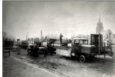
Hout laden bij het spoor

De timmerindustrie bloeide als nooit tevoren. De oorlog was al een aantal jaren geschiedenis, Nederland herrees, er werd gebouwd. Toen de bouw op stoom kwam en er kozijnen, deuren, kasten e.d. nodig waren, kon de Bergambachtse timmerindustrie er vrijwel direct op inspringen. De fabrieken waren er al en er was personeel. Dankzij een familie die ruim honderd jaar eerder in Bergambacht neerstreek was er een stevige basis voor een succesvolle industriepoot gelegd. Dat succes duurde een aantal decennia, totdat marktomstandigheden zodanig verslechterden dat het merendeel van de bedrijven het loodje legde. Fusies boden in eerste aanleg nog soelaas, maar niet voor lang. Van de ooit 9 timmerfabrieken resteren er nog 3: De Jong, Macdaniël en Van Erk.