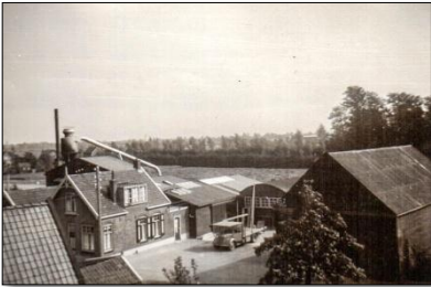
Kleijn aan de Parallelweg