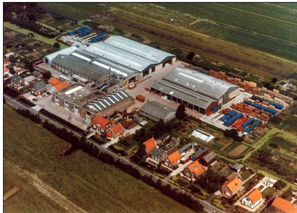
Het fabriekscapex van Bouter & Zn aan de Dijklaan Aan de westzijde staan nog geen woningen