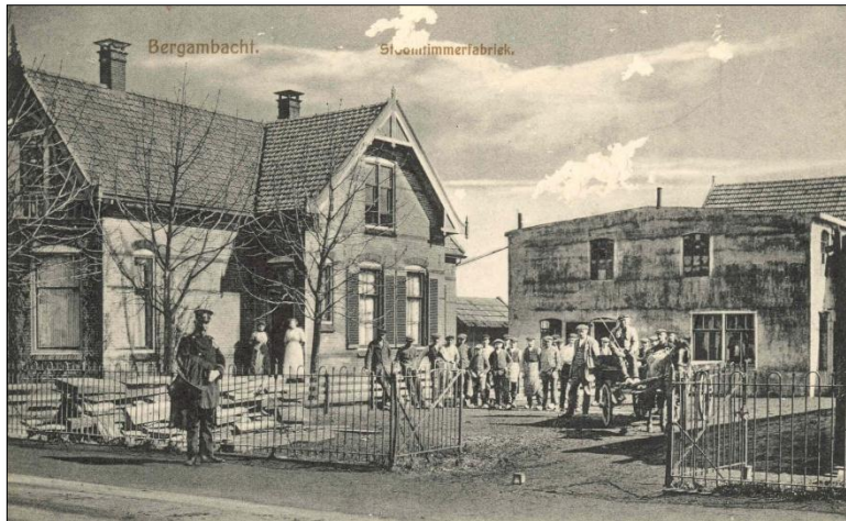
De eerste timmerfabriek in Bergambacht aan het einde van de Breedeweg (nu Hoofdstraat), ter hoogte van het tegenwoordige 't Ingse Hof. 1902-1924

In de jaren '50 en '60 van de vorige eeuw trok in Bergambacht elke middag om 12 uur onder luid gebeier van de torenklok een kleine processie door het dorp. De deelnemers waren doorgaans identiek gekleed, alleen de kleur van hun outfit verschilde. Velen waren in kaki, hoewel blauw ook nadrukkelijk haar stempel drukte. Groen was een gerespecteerde minderheid. De kleur gaf aan bij welke timmerfabriek ze werkten, hoewel er ook enkele fabrieken waren die dezelfde kleding gebruikten. In tegenstelling tot een echte processie bewoog men zich niet te voet voort, maar op de fiets, uitgezonderd de enkele brommerrijder. Kort voorafgaand aan de optocht was uit alle windstreken het geluid van sirenes of het