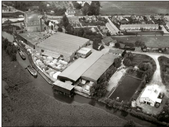
Timmerfabriek De Concurrent in de jaren '50 Let op het zwembad (rechts)