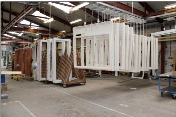
Puienproductie bij Adriaan van Erk