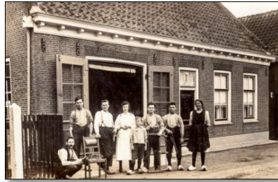
Wagenmakerij Van Stam

Achter de woning bouwde hij een kleine timmerwerkplaats. In 1933 bouwde hij het dubbele woonhuis naast het dokterspand 't Ing van 't durp. Er achter werd de timmerwerkplaats uitgebreid en ontstond er een kleine fabriek. Na het vertrek van Macdaniël naar de Dijklaan in de jaren '50 betrok Transportbedrijf De Langen de gebouwen. Uiteindelijk verdween ook De Langen naar het industrieterrein De Nieuwe Wetering.