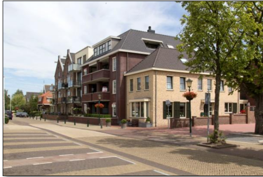
't Ingse Hof waar in 1902 de eerste timmerfabriek stond

Ik wil proberen de geschiedenis van de opkomst en neergang van deze industrietak in dit artikel weer te geven.