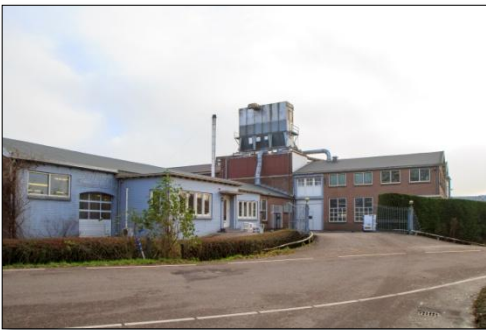
De Jong's Timmerfabriek in Bovenberg

De fabriek van Macdaniël werd overgenomen door de gebr. Kooy en functioneert nog steeds onder die naam. Massaproductie is echter niet meer aan de orde.