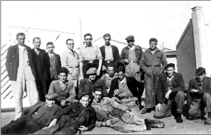
Personeel Berga eind jaren '50

visie. Het was duidelijk dat tijdens de opbouw van het naoorlogse Nederland grote orders waren te verwachten. Die zouden door één