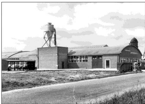
Samenwerking De nieuwe fabriekshal in 1958