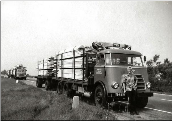
Bas Casteleijn, chauffeur bij Botter Transport met een vracht hout

Kooy aan de Dijklaan resteert van de in totaal 9 fabrieken die in dit artikel de revue passeerden.