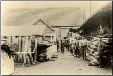
De fabriek aan de Breedeweg

donkere harde gebrom van iets dat op een toeter leek, te horen geweest. De werknemers schakelden hun machines uit en legden hun hamers, beitels en schaven neer. Het was middagpauze, nee geen schafttijd, die was halverwege de ochtend. Lunchen? Dat woord werd hier niet gebruikt. Ze gingen op weg naar de warme prak. In die jaren boden de timmerfabrieken werk aan ruim 400 werknemers, nog afgezien van indirecte betrokkenheid van andere bedrijven zoals transport e.d.