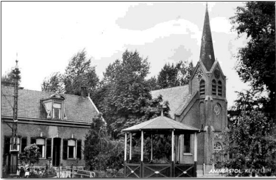
Ammerstol, Herv. Kerk en muziektent. (jaren '50)