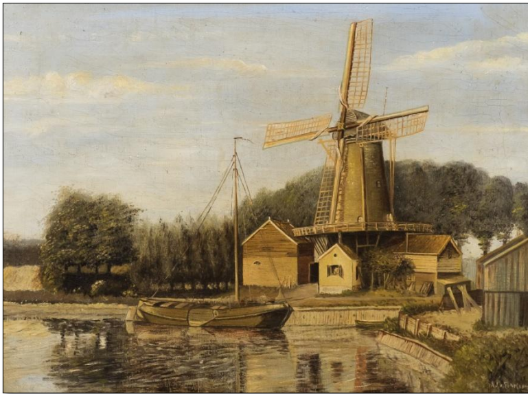
Molen De Onverwacht.

“Maar de meest briljante helderheid kan niet anders gerealiseerd worden dan met een beetje wit en gele oker. Men moet deze grastonen op doek overzetten, ze warm maken, fluwelig, geurig, (...)”, meende schilder Jacob Maris. Daarmee kan hij het gras van de weilanden uit de Krimpenerwaard bedoeld hebben, want het is zeker dat leden en navolgers van de Haagse school hier hebben gewerkt. Ook veel andere kunstenaars uit verschillende