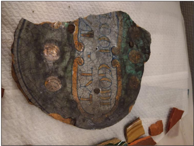
Aardewerk uit plm. 1610-1630

Deze week is voor ons team bijzonder leerzaam geweest en op deze wijze komen we steeds meer te weten hoe onze voorouders hebben geleefd, gewoond, wat voor materiaal ze gebruikten en zelfs wat ze hebben gegeten.