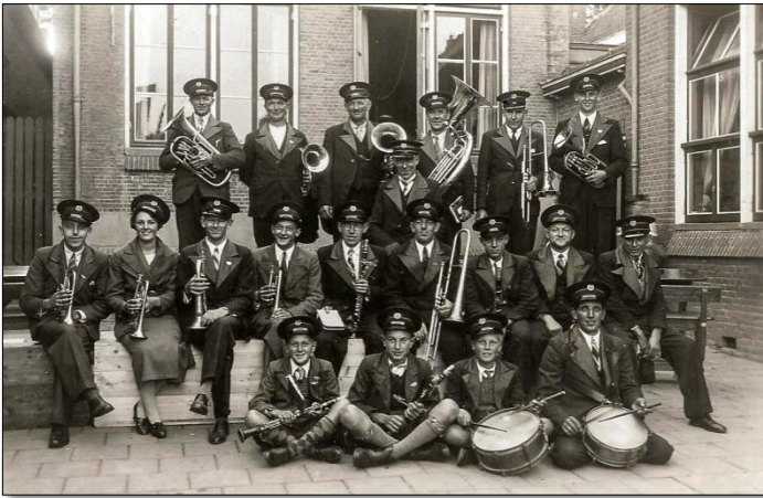
Muziekvereniging Excelsior op het schoolplein aan de Meent (jaren '50) 27