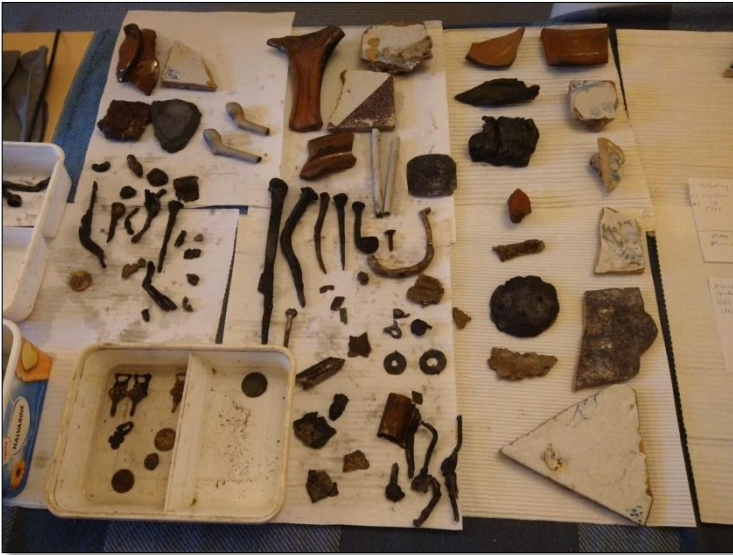
Een deel van de opgegraven objecten

Het meest logische in die tijd was dat je tegels bestelde in Rotterdam of Gouda, beide steden hadden tegelfabricage. Een van onze leden heeft een zeer goede metaaldetector en daar zijn ook tal van voorwerpen mee gevonden, denk hierbij aan verschillende duiten (koperen muntjes) en zelfs 1 zilveren muntje, mantel gespen, vingerhoeden, gesmede spijkers, een klein metalen knoopje en tal van andere zaken. In 2 afzonderlijke beerputten werd een leren schoen gevonden, sommige van deze kleine vondsten dateren zelfs van voor de 17 e eeuw. Soms zijn beerputten schatkamers want bij epidemieën in stad of dorp werd vrijwel alle huisraad in de put gegooid, helaas voor ons geen schatten.