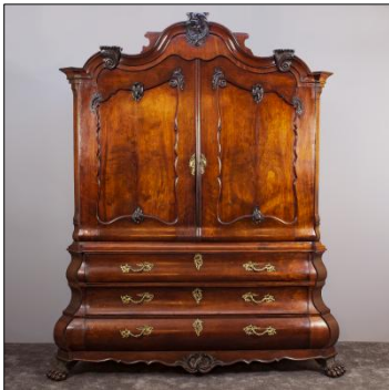
Kabinetkast uit de 19 e eeuw

In het Streekmuseum Reeuwijk, het Streekmuseum Krimpenerwaard en Museum De Koperen Knop in Hardinxveld-Giessendam zijn deze kasten met linnengoed uitgebreid te bewonderen. In deze kast werd ook het doodskleed of doodshemd bewaard. Het was traditie dat deze hemden vóór het huwelijk werden gemaakt door de jonge vrouw voor haar en haar toekomstige echtgenoot, om slechts twee keer te worden gebruikt: Tijdens de huwelijksnacht en bij de uitvaart. Ze waren eenvoudig van ontwerp, vaak een recht lang hemd met driekwart mouwen.