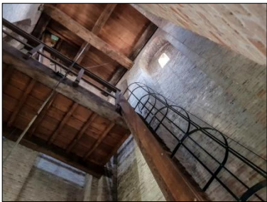
Trap naar halve zolder

We ontvingen voor de torenbeklimming 85 deelnemers, die steeds in groepen van maximaal 10 naar boven konden onder begeleiding van 2 gidsen. Het zijn nou niet bepaald trappen die berekend zijn op groepen bezoekers, dus het was uitkijken geblazen en je goed vasthouden. Vooral op de 2 e halve zolder, waar vroeger de slangen van de brandweer te drogen werden gehangen en je meters naar beneden kunt kijken.