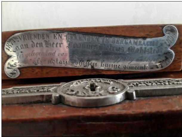
De sluitplaat met herinneringstekst op het bureau