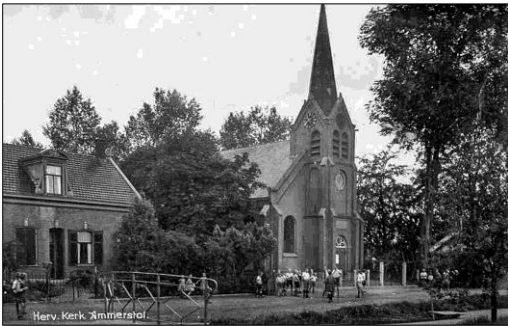
De kerk in de jaren '30 Van de vorige eeuw.

het bord is onbekend. Ook de twee psalm- en gezangenbordjes worden aan hem toegeschreven. Van de drie kroonluchters komen er twee uit 1709, van de derde is niets bekend. Op zowel de kroonluchter bij het orgel, als op die bij de liturgietafel zijn inscripties aangebracht die verwijzen naar de familie Eyssonius als schenkster ervan. De familie Eyssonius was van zeer gegoede huize. Tot hen behoorden zowel een hoogleraar geneeskunde als een hoogleraar anatomie.