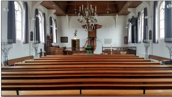
Interieur van de Ned. Herv. Kerk in Ammerstol met elementen van de oude kruiskerk uit de 14 e eeuw.

gebouw zijn diverse oude items en materialen uit de kruiskerk uit 1331 gebruikt, zoals wordt beschreven in het bestek van de nieuwe kerk.