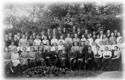
Gemengd koor Nut en Genoegen