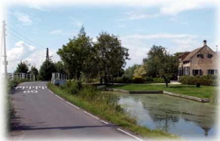
Bokpalen bij de Vlietbrug

Achter ons huis aan de Dijkklaan zagen we de Melkweg als een lichtende band, bezaaid met sterren die - wanneer ik me goed herinner - van zuid-west naar noord-oost liep. Zelfs het noorderlicht was een enkele keer goed waar te nemen. Dat is nu vrijwel onmogelijk door de overvloedige buitenverlichting. De gas- en olielantaarns verdwenen uit het straatbeeld, de lantaarnopsteker verloor zijn baan. Jarenlang had hij in de vooravond zijn ronde gemaakt om ze aan te steken en tegen de ochtend weer te doven. Overal waar elektriciteit moest komen verschenen bokpalen waarlangs de transportleidingen liepen. Je vindt ze nu nog in de Beneden- en Bovenberg en Vlist en enkele andere buitengebieden. Zulke