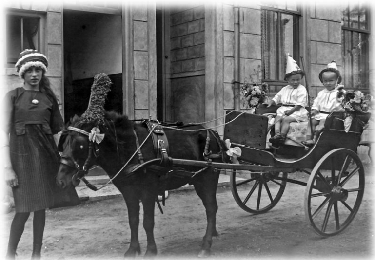
Deelnemers aan de optocht in 1913 t.g.v. 100 jaar koninkrijk