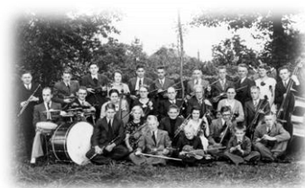
Het Bergambachts Strijkje

De verenigingen schoten als paddenstoelen uit de grond. Bijzonder is dat de naam Excelsior landelijk sterk favoriet was. Iedereen wilde ‘Steeds Hoger.’ Veel fantasie had men blijkbaar niet op dat vlak, hoewel de gebrekkige communicatie in die tijd daar wellicht mede debet aan is. Wanneer je een vereniging opricht, lijkt het me niet voor de hand liggend dat je die dezelfde naam geeft als in een plaats 10 km verderop. Zo ging het trouwens ook met THOR, (Tot Heil Onzer Ribben). Talloze gymnastiekverenigingen heetten zo. In Berkenwoude kreeg de in 1903 opgerichte muziekvereniging een wat