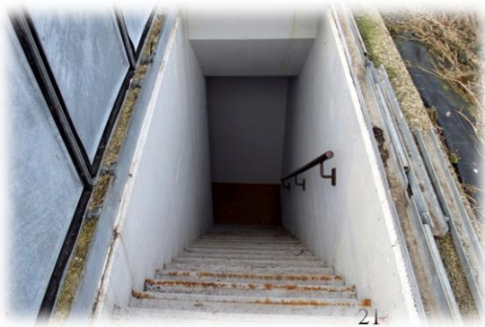
De ingang van de atoombunker naast de Algerabrug in Krimpen aan den IJssel.

veel parallellen met tegenwoordig. En zo gebeurde het dat de bevolking in een officiële bruine enveloppe instructies kreeg toegestuurd door het Ministerie van Binnenlandse zaken. Het werd steeds dreigender. Er werd druk geoefend door de BB, de Bescherming Burgerbevolking, een organisatie die was opgezet om bij rampen en in oorlogstijd als hulpverleners op te treden. Ze bestond voor een groot deel uit mannen die om verschillende redenen waren vrijgesteld van militaire dienstplicht en zgn 'buitengewoon dienstplichtig' waren. Het dorp was in wijken verdeeld die elk onder een 'blokhoofd' vielen. Naast de voordeur van zijn woning was een schildje aangebracht waarop was aangegeven dat hier een blokhoofd woonde. De BB was in 1952 opgericht toen de koude oorlog in opkomst was. In 1958 werd de noodwachtplicht ingevoerd voor de eerder genoemde buitengewoon dienstplichtigen. Die oodwachtplicht bleef in stand tot de opheffing van de BB in 1986.