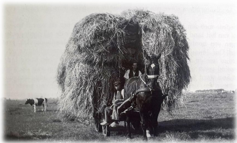
1957 Met een voer hooi naar de boerderij