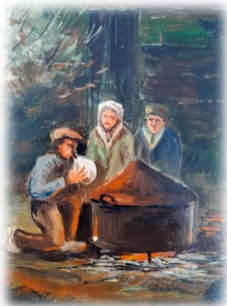
Het opblazen van de varkensblaas Schilderij van Aart Brand

Knelis is nog een tijdje doorgegaan bij slager De Groot, waar hij ook nog wel eens spek liet roken. Ook schoot hij nog voor de noodslachting bij Gijs de Mik. Toen de schietvergunning op enig moment werd ingenomen was het klaar.