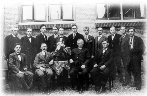
Mannenkoor Nut en Genoegen