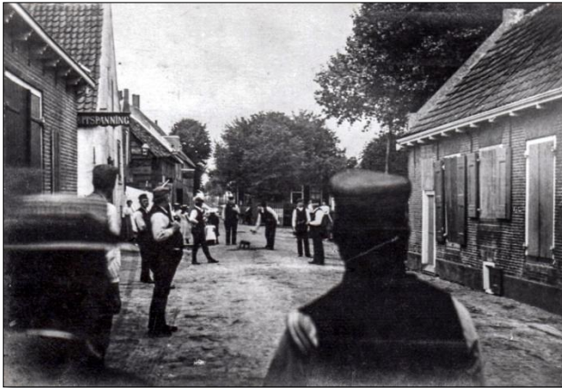
Kaatsen in de Dorpsstraat in Berkenwoude.

De Kaatsliefhebbers uit den Achterbroek Noodigen uit de liefhebbers van kaatsen te Stolwijk, om in de genoemde buurt te komen KAATSEN. De prijs van ieder spel is gesteld op ÉÉN GULDEN, terwijl in geen geval vermindering van die prijs wordt toegestaan