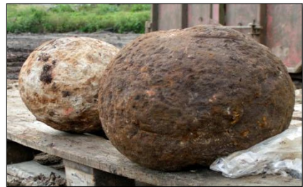
Opgraven en enkele vondsten van het kasteelterrein

De historische verenigingen in de Krimpenerwaard zijn voornamelijk opgericht omdat men de maatschappij in aanloop naar het jaar tweeduizend steeds sneller zag veranderen en dat brengt automatisch onrust, vragen en bezinning met zich mee. De Krimpenerwaard met zijn bewoningsgeschiedenis vanaf het jaar duizend is nog nooit verkaveld.