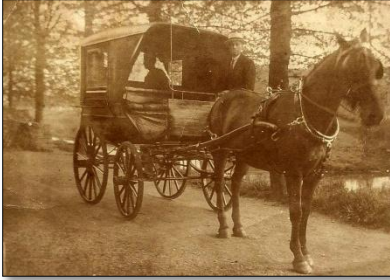
Met mooi gerij ter kerke

men schroomde niet om met de verworven rijkdom te pronken. Fraaie engelenramen in de voorgevel waren vaker regel dan uitzondering en de boer ging op zondag in mooi 'gerij' en de boerin getooid met goud en zilver ter kerke. Politieke keuzes leidden er toe dat vanaf de jaren '50 in de 20 e eeuw dit beeld veranderde.