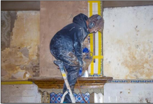
Het loszagen van de tegels

In de voormalige woonkamer zat de schoorsteen met o.a. het tegeltableau.