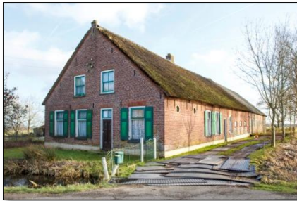
Tussenlanen 49

In februari van dit jaar was ik op een vergadering toen iemand naar mij toekwam en zei: “weet jij het telefoonnummer en adres in Bergambacht van diegene die een antieke schoorsteen met gekleurd tegeltableau aanbiedt op Marktplaats? Ik was even stomverbaasd dat zoiets überhaupt nog kon gebeuren, maar goed, het bleek waar te zijn. Het ging om de leegstaande boerderij Tussenlanen 49.